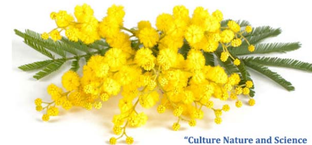
"Culture Nature and Science in the Present and in the Past"

ERASMUS PROJECT 2015-2017 TEACHERS' MEETING CAPO D'ORLANDO 7-11 MARCH 2016