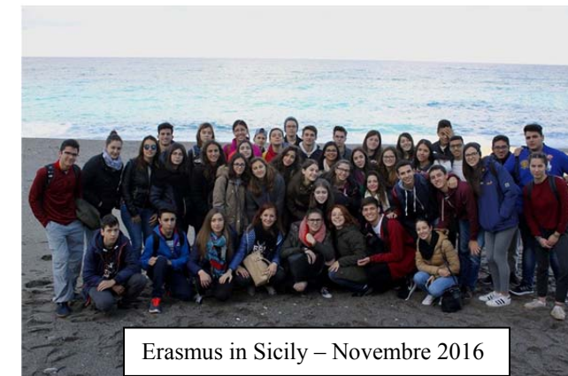
Erasmus in Sicily – Novembre 2016

ERASMUS PROJECT 2015-2017 TEACHERS' MEETING CAPO D'ORLANDO 7-11 MARCH 2016